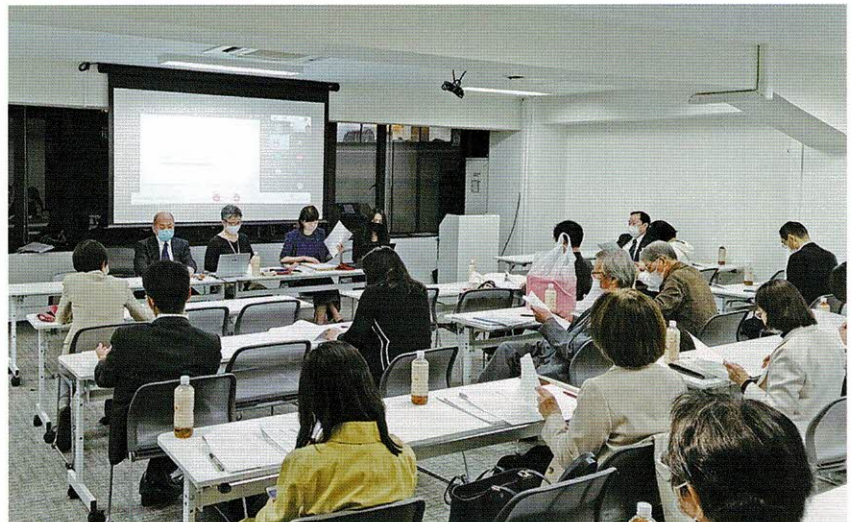
初のリモート併用定時総会の開催風景

改革は常に対立から始まりますが伝統は調和なくして守ることは出来ません。徽章のコスモスの花言葉が「調和」であることを常に忘れないようにしたものです。