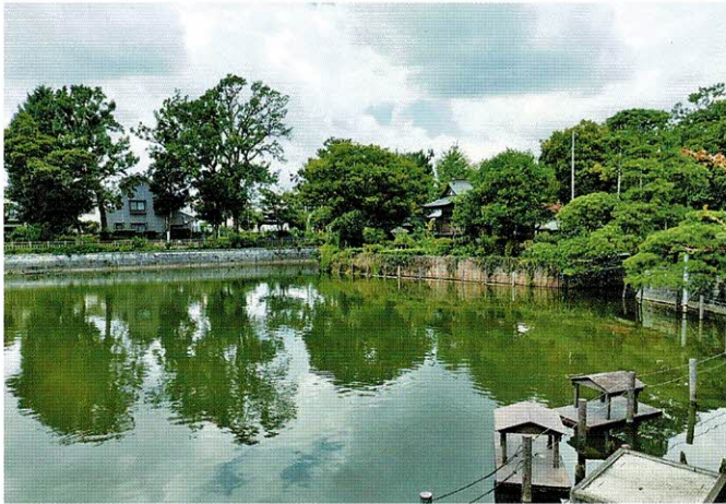
碑文谷公園清水池