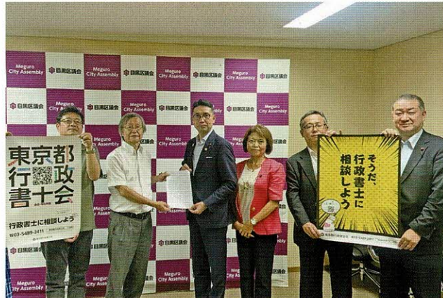
自民党区議団との意見交換会（左）と公明党区議団との意見交換会（右）