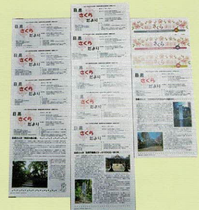
左から 行政目黒 NEWS、さんまのつぶやき、目黒さくらだより